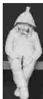
AUTOR: Petr Soudek, Hroznová 2