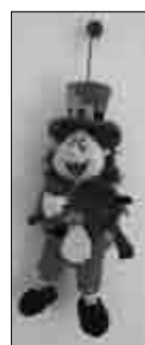
VODNÍK, který již visí ve mlýně