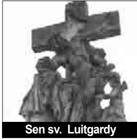
Sen sv. Luitgardy