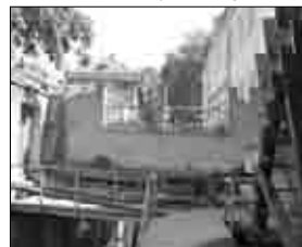
KAMPA z pohledu vodníka