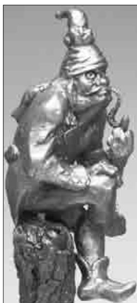
AUTOR: Sochař Josef Nálepa z Malostranského náměstí