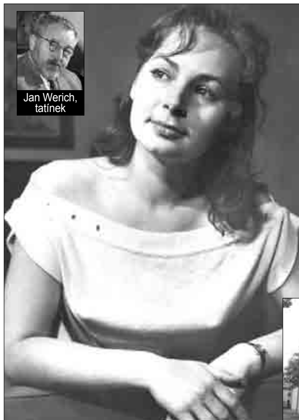
Jan Werich, tatínek

J ediná dcera Jana Wericha žila ve slavném domě na Kampě do tří a pak od 10 let, kdy se vrátila s rodiči ze Spojených států.