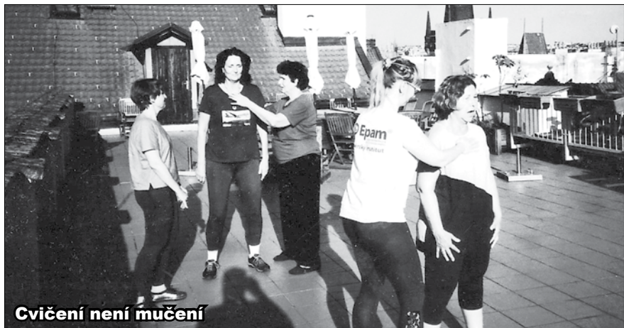
Cvičení není mučení

kteřá může klientům pomoci najít harmonii těla a duše a zvýšit motivaci k péči o sebe. Naši základní ozdravnou metodou je POHYB. Podle přes dva tisíce let starého učení řeckého lékaře Hippokrata správný pohyb nahradí žádný lék. Pohyb je nejstabilnější a nejbezpečnější cesta ke zdraví. Protože víme, že každý jsme individuální po fyzické i psychické stránce, nabízíme klientům možnost vyzkoušet si různé druhy cvičení. Cviky řadíme do sestav, které se klienti postupně na lekcích naučí a cvičí je doma (různě přizpůsobené aktuálnímu zdravotnímu stavu a tomu, aby je cvičení bavilo a bylo pro ně příjem-