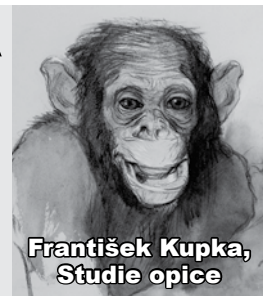
František Kupka, Studie opice