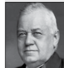
Josef Šváb Malostranský HEREC