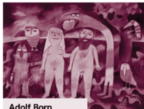
Adolf Born Adam, Eva a had

VYBÍRÁME Z AUKCE ŘÍJEN. UKONČENÍ AUKCE 24. - 26. 10. 2023