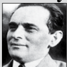
Karel Poláček, spisovatel