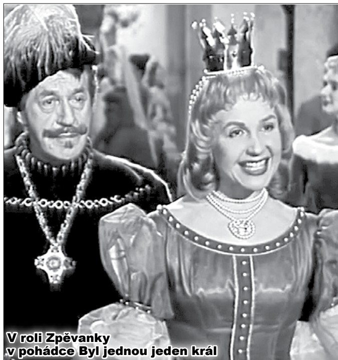
V roli Zpěvanky v pohádce Byl jednou jeden král