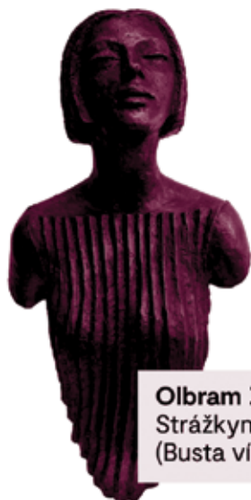
Olbram Zoubek Strážkyně vod, (Busta víly)

Pokud máte nějaký zajímavý obraz, kresbu, grafiku, sochu, mince či jiný umělecký artefakt, budeme rádi, když nám ho nabídnete.