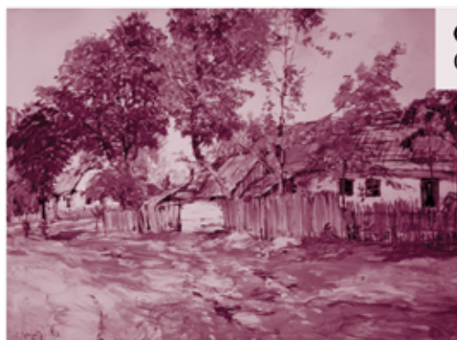
Oldřich Blažíček Chalupy na Valašsku