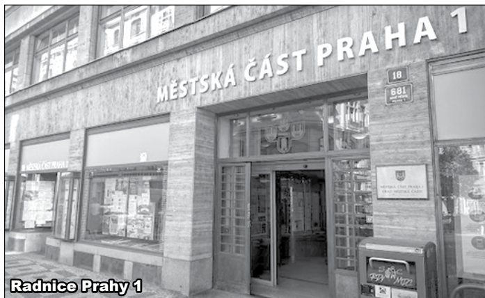
Radnice Prahy 1