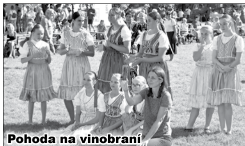
Pohoda na vinobraní