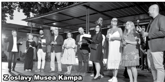
Z oslavy Musea Kampa