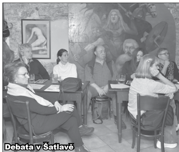
Debaty v Šatlavě

debaty, přednášky, kino, divadlo, atelier-galerii, spol. místnost pro spolky a stolní společnosti, pro všechny generace - seniory i tvůrčí mládež.