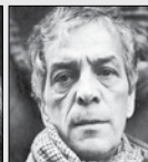
Pavel Juráček REŽISÉR