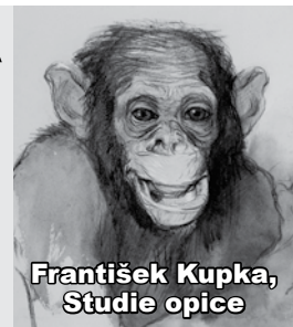
František Kupka, Studie opice