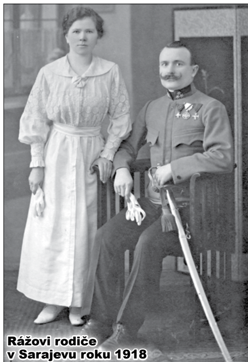
Rážovi rodiče v Sarajevu roku 1918