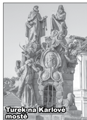
Turek na Karlově mostě