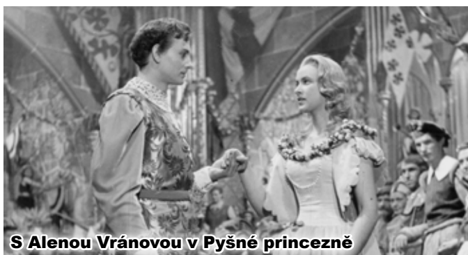
S Alenou Vránovou v Pyšné princezně