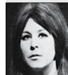
Eva Olmerová ZPĚVAČKA