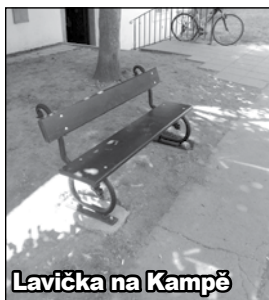
Lavička na Kampě

S oblíbeným Klubem Šatlava v Saské ulici, kam si chodí řada lidí zazpívat, to nejprve nevypadalo vůbec dobře. Nečím se obyvatelům domu, že si stěžovali - jedna věc je jít se večer pobavit a druhá věc je mít nedobrovolně v bytě hluk, když chce člověk spát. Nebytový prostor v Saské nebyl nikdy zkolaudován jako hudební klub, a tak došlo k tomu, že Šatlava dostala výpověď. Tím to celé mohlo skončit, ale spolková „šatlavská hudební činnost“ bude našťastí