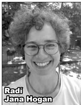
Radí Jana Hogan

Jednou z metod nastavení nových programů myšlení, emocí, chování může být opět metoda zrcadla, tentokrát fyzického. Postavíme se před zrcadlo, podíváme se zhluboka do očí a řekneme si vše, co potřebujeme slyšet k zahojení jizev. Vše, co potřebuje slyšet dítě/žena/muž v nás. Přepsat staré programy, nastavené