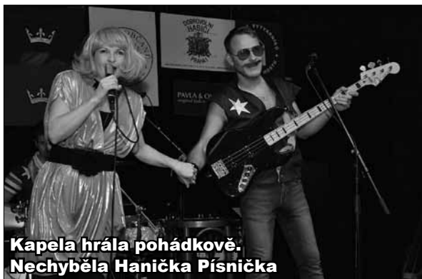
Kapela hrála pohádkově. Nechyběla Hanička Písníčka