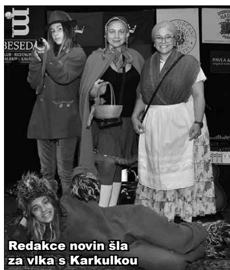
Redakce novin šla za vlka s Karkulkou