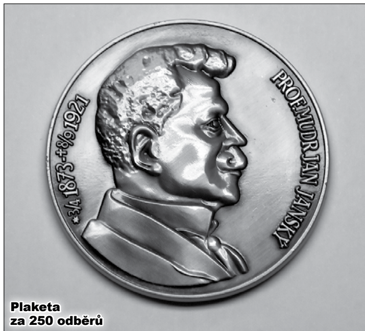
Plaketa za 250 odběrů