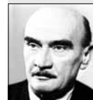
Karel Hašler PISNÍKÁŘ