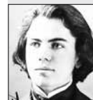
Jan Kubelík HOULISTA