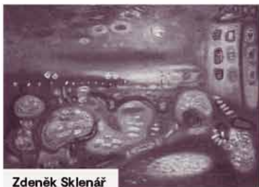
Zdeněk Sklenář Nábřeží k ránu (Kampa)

VYBÍRÁME Z VÁNOČNÍ AUKCE. UKONČENÍ AUKCE BUDE 7. - 9. 12. 2021.