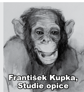
František Kupka, Studie opice