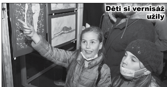
Děti si vernisáž užily

Do 4. prosince můžete navštívit výstavu spojenou s projektem Zachraňte plcha velkého. V půdních prostorech Werichovy vily najdete překrásné obrázky dětí s tematikou zvířecích obyvatel Petřína v čele s již dobře známým plchem velkým. Výstava organizovaná společností Femancipation a Petřínská iniciativa navazuje na populární naučnou stezku na Petříně a na uměleckou soutěž pro děti. Ti neúspěšnější soutěžící byli oceněni již v květnu v Českém mu-