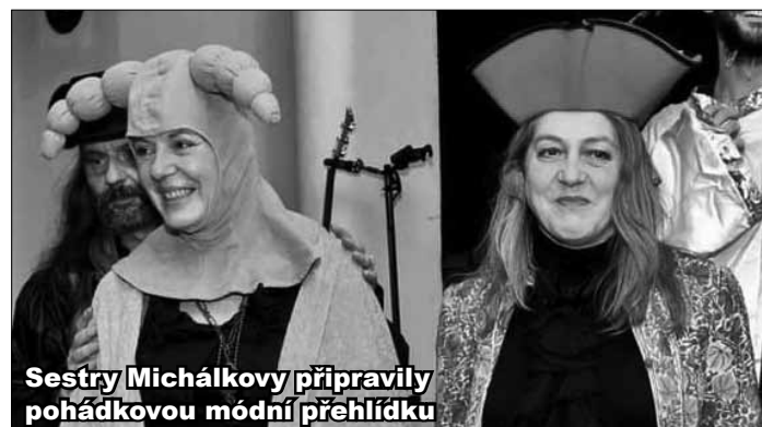
Sestry Michálkovy připravily pohádkovou módní přehlídku