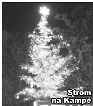
Strom na Kampě

Myslím, že nejhorším průvodním jevem zákeřného viru je strach. Ten nás oslabuje nejvíce. Připomínám, že jsem očkován, jak má být, a bez předepsané roušky mě