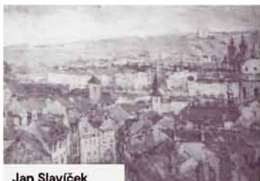
Jan Slaviček Pražské střechy

Pokud máte nějaký zajímavý obraz, kresbu, grafiku, sochu, mince či jiný umělecký artefakt, budeme rádi, když nám ho nabídnete.