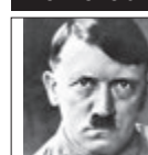
Adolf Hitler, nepřítel

Františka Plamínková (1875 - 1942) byla novinářka, politička a organizátorka ženského hnutí. Byla vynikající, pohotová a vtípná řečnice. Od mládí se pravidelně stýkala s rodinou Masarykových.