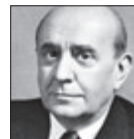
Jan Masaryk, kamarád