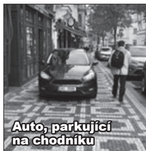
Auto, parkující na chodníku

I když pokud je to opravdu ateista, tak spíš zakleje. Naneštěstí si tím zadělává na to, že mu ujede tramvaj, protože uvěří vězním hodinám u Mikuláše, které jdou stále o pět až deset minut pozdě. V takové situaci zakleje každý, ať je ateista, nebo neateista. Strípky nepořádku v hlavních ulicích Malé Strany mají jedno společné. Instituce od-