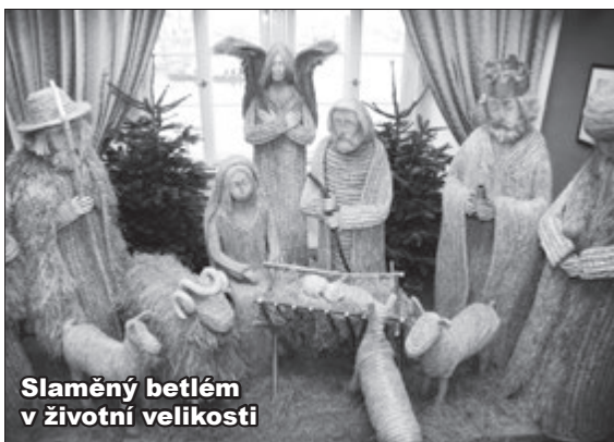
Slaměný betlém v životní velikosti

Muzeum představí své unikátní betlémy, například Slaměný betlém v životní velikosti, Vltavský rybí betlém zapsaný v České knize rekordů, Africký z ebenového dřeva, Námořnický či betlém z kukuřičného šustí.