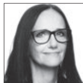
Jarka Nárožná Divadélko Romaneto

„Věřím, že dvojnásobnou radost, hlavně pak na pražské jedničce.“