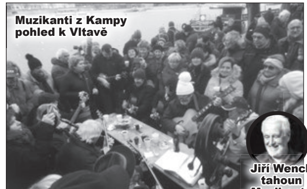
Muzikanti z Kamy pohled k Vltavě