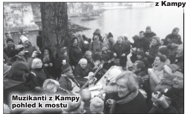
Muzikanti z Kamy pohled k mostu