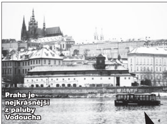
Praha je nejkrásnější z paluby Vodoucha