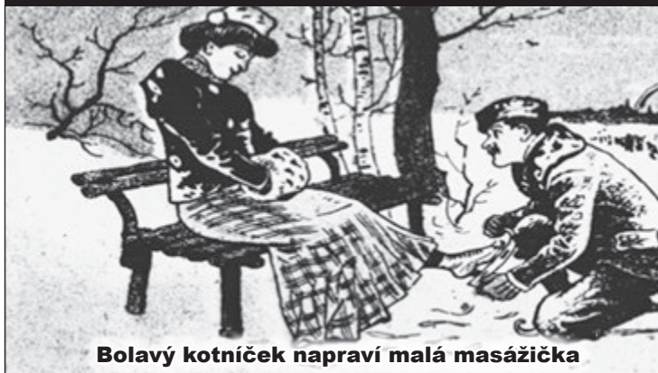
Bolavý kotníček napraví malá masážička

StaroBrněnské noviny k počtě Humoristickým listům (1920)