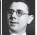
Jaroslav Ježek SKLADATEL

• Jaroslav Ježek *25. 9. 1906 Praha †1. 1. 1942 New York Skladatel, klavírista. Na Hradčanech je po něm pojmenována škola.