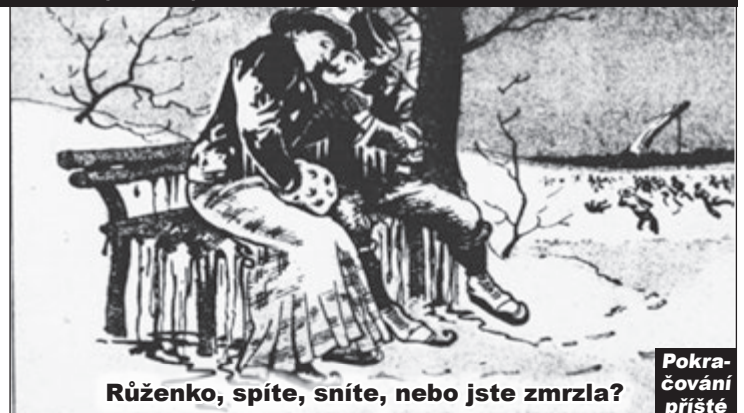
Růženko, spíte, sníte, nebo jste zmrzla?