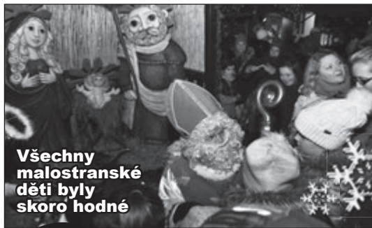
Všechny malostranské děti byly skoro hodné

Akci pořádal SOPMSH ve spolupráci se Sdružením výtvarníků Karlova mostu, Dobrovolných hasičů a za podpory MČ Praha 1.