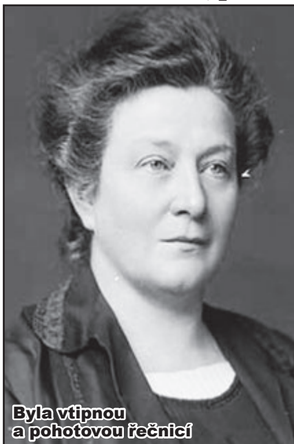
Byla vtípnou a pohotovou řečnicí