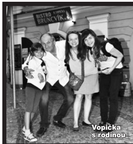
Vopička s rodinou