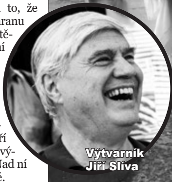
Výtvarník Jiří Slíva