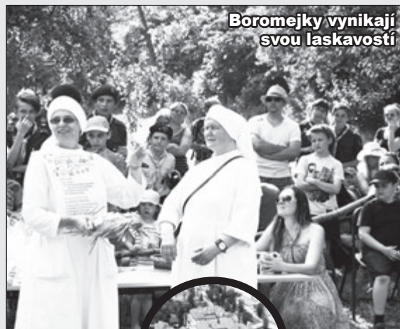
Boromejky vynikají svou laskavostí