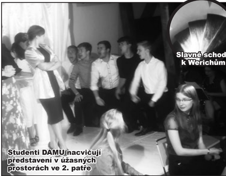
Studenti DAMU nacvičují představení v úžasných prostorách ve 2. patře