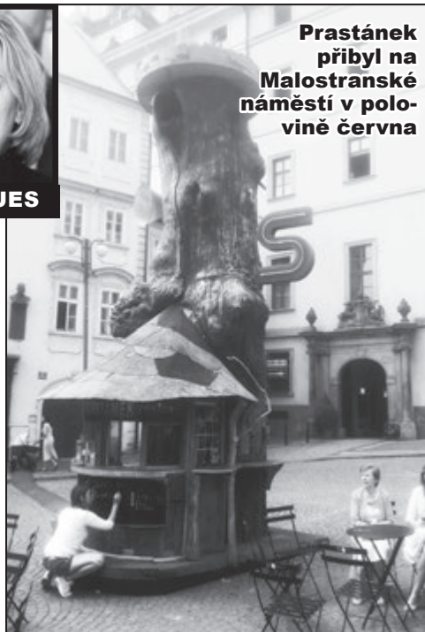
Prastánek přibyl na Malostranské náměstí v polo- vině června