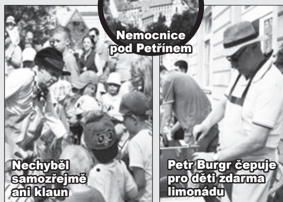
Nemocnice pod Petřínem