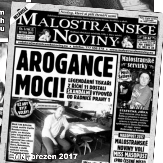
MN, březen 2017