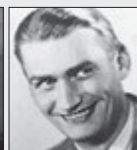
Ladislav Boháč HEREC