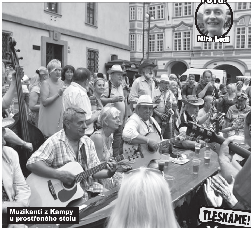
Muzikanti z Kamy u prostřeného stolu