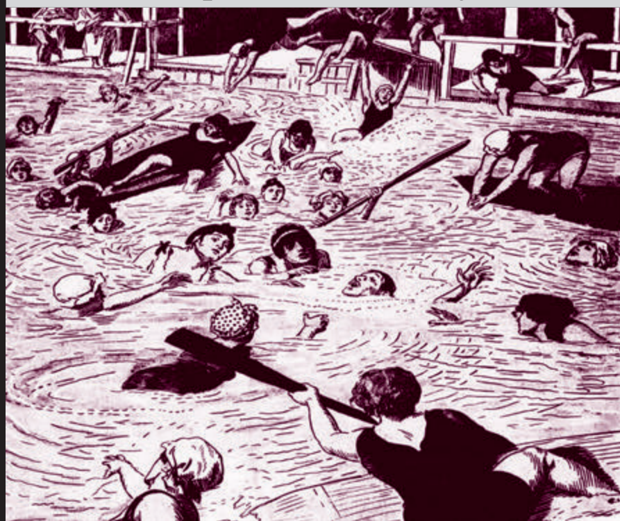
NA PLOVÁRNĚ: „Co se to tam děje?“ „Ale, topí se mladý muž a každá z těch dívek ho chce zachránit, aby si ji vzal.“