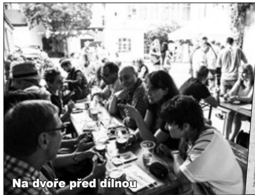
Na dvoře před dílnou