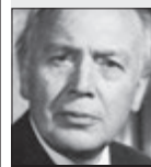
Václav Trojan REŽISÉR