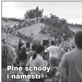
Plné schody i náměstí

Těleso zpěváků a hudebníků si zahrálo a zazpívalo na náměstí Na Kampě 23. června Rybovu Českou mši vánoční. Byla to skvělá generálka na koncert, který tu bude o Vánocích. Zpívaly stovky lidí.