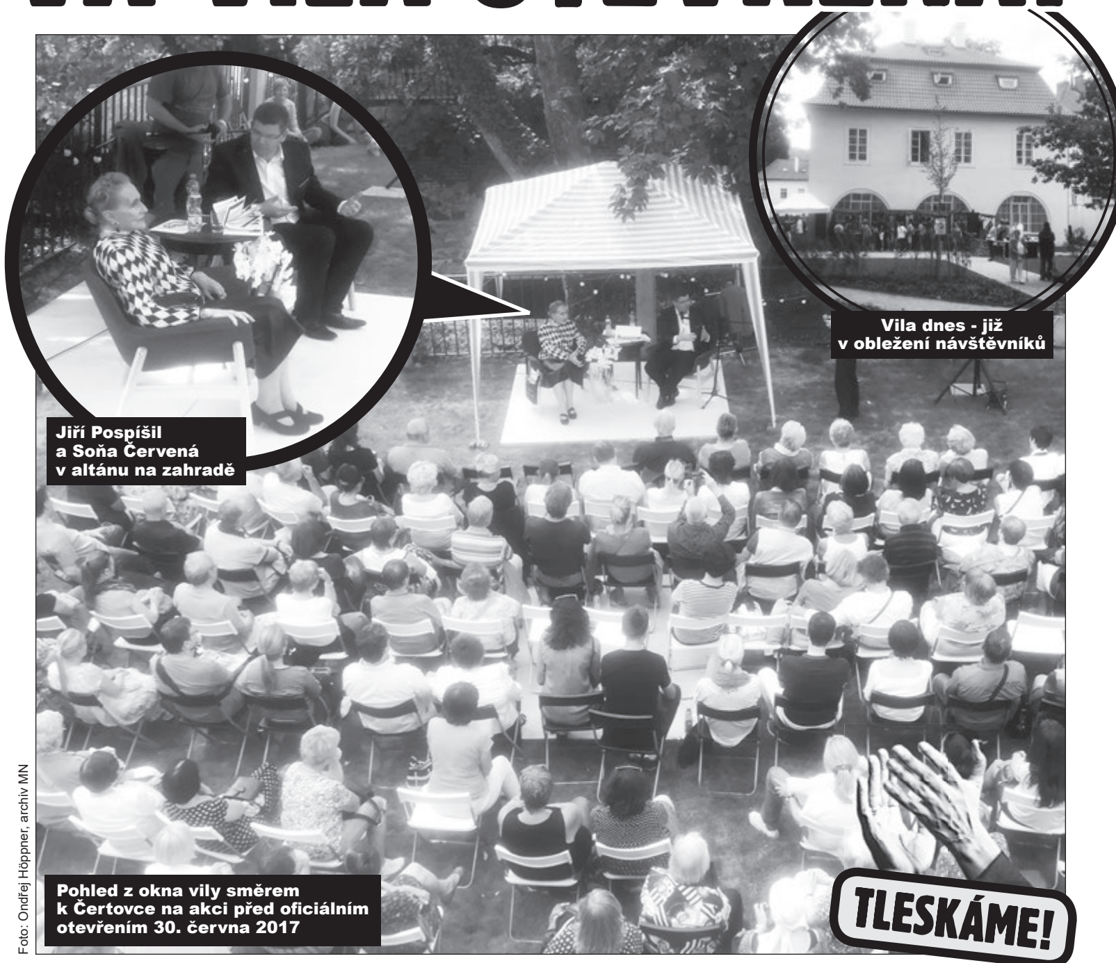
Vila dnes - již v obležení návštěvníků