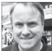
Martin Bursík Exministr živ. prostředí

„Budeme v létě odpočívat a pracovat na milovaných Hradčanech.“