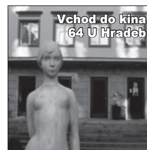
Vchod do kina 64 U Hradeb