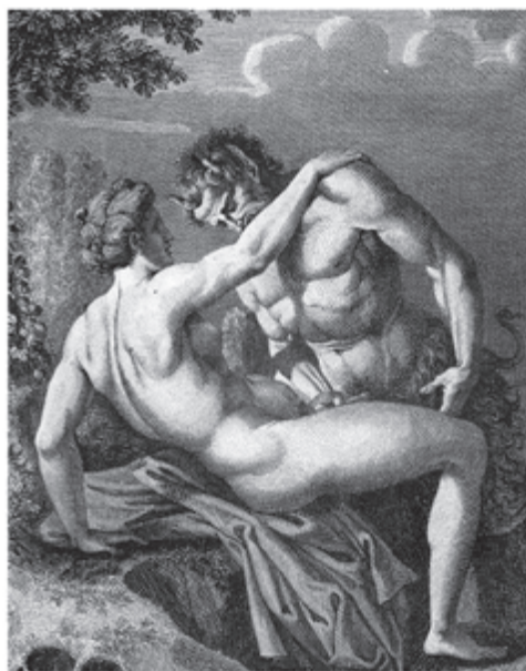
Il Satiro e la Ninfe, 1527 Giulio Romano /1499 - 1546/, I Modi

PORNO HŘÍCHY MĚSTA NA LAGUNĚ V ÚTERÝ 14. ÚNORA V 17:17