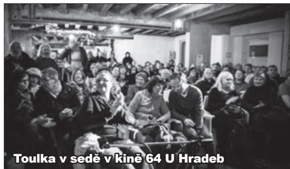
Toulka v sedě v Kině 64 U Hradeb