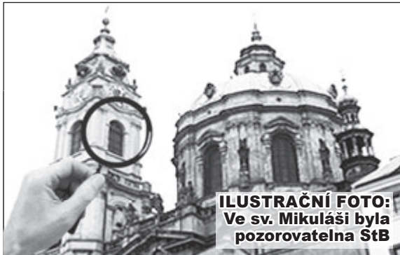
ILUSTRACNÍ FOTO: Ve sv. Mikuláši byla pozorovatelná StB

Policie pokračuje ve vyšetřování případu možných podvodů (tzv. plechtichy) při privatizaci 23 bytů v Praze 1. Zatím nebyl nikdo obviněn.