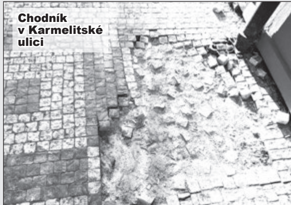
Chodník v Karmelitské ulici

To „raného“ musí průvod- ci zdůraznit, aby se nedo- tkli pověsti našich předků, protože například v době Karla IV. pražští konšelé