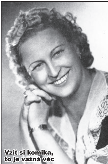
Vzít si komika, to je vážná věc