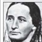
Božena Němcová SPISOVATELKA