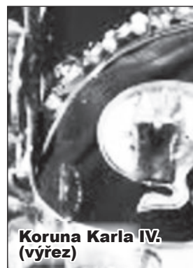
Koruna Karla IV. (výřez)

z koček, co tak krásně předou a zbytek už si ne- chám zdát.