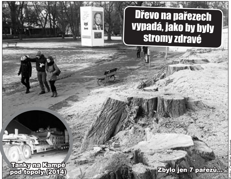
Tanky na Kampě pod topoly (2014)

„To nám teď chtějí vykácet celou Kampu?“