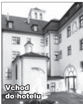
Vchod do hotelu

Neděle se ponese ve znamení dobrého jídla - slavnostní obědový buffet v restauraci s letní terasou za 555 Kč (děti do 10 let: 55 Kč), svatotomášské pivo vařené podle histo-