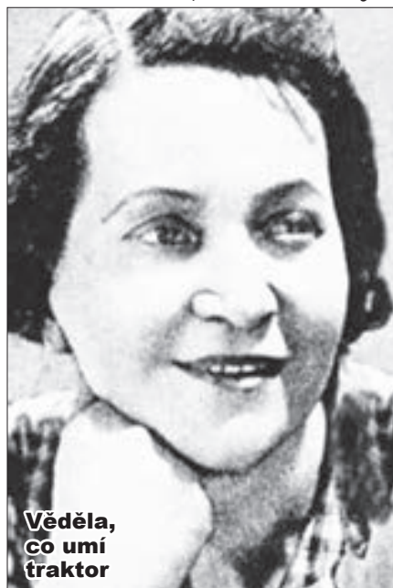
Věděla, co umí traktor