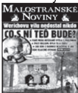
Malostranské noviny č. 4, duben 2014

Malostranské noviny jsou úžasné. Jsou to nejen „nejlepší noviny ve městě“, jak máte uvedeno v záhlaví, ale dokonce nejlepší noviny, co znám. Chtěl jsem vám moc poděkovat za to, co děláte. Dělejte to dál, držím vám palce.