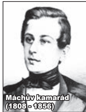
Máchův kamarád (1808 - 1856)