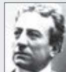
Eduard Vojan HEREC