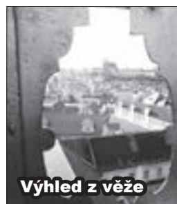
Výhled z věže