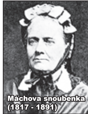
Máchova snoubenka (1817 - 1891)