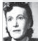
Eva Svobodová HEREČKA