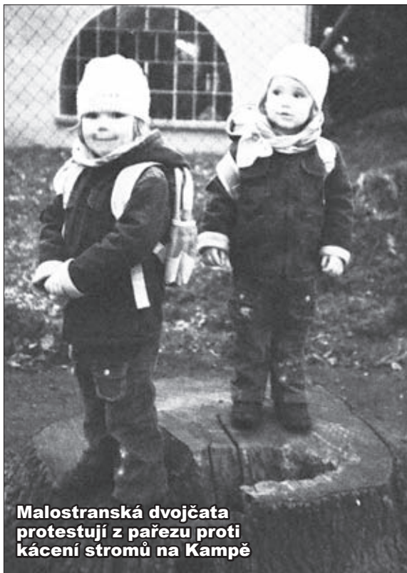
Malostranská dvojčata protestují z pařezu proti kácení stromů na Kampě

Prostě zachovat volnost anglického parku. Čas ukázal, že naši předkové určili vzhled a atmosfé-