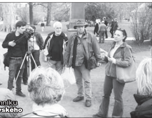
Diskuze u pomníku Josefa Dobrovského