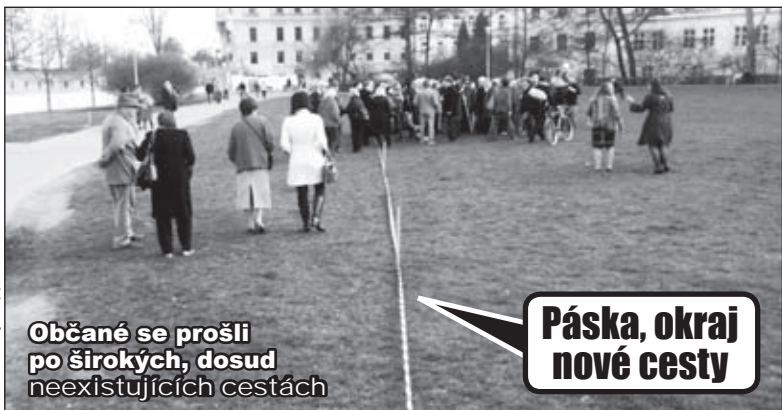
Občané se prošli po širokých, dosud neexistujících cestách