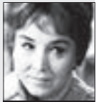
Jana Dítětová HEREČKA

• Jan Zrzavý *5. 11. 1890 Okrouhlice †12. 10. 1977 Praha Malíř. Bydlel na Zámeckých schodech.