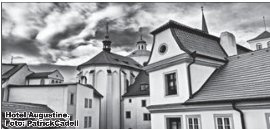
Hotel Augustine.

Jedna z dalších novinek, která se udála u nás v Augustine hotelu a o které