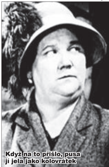
Když na to přišlo, pusa jí jela jako kolovrátek