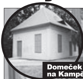
Domeček na Kampě