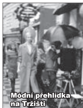
Módní přehlídka na Tržišti