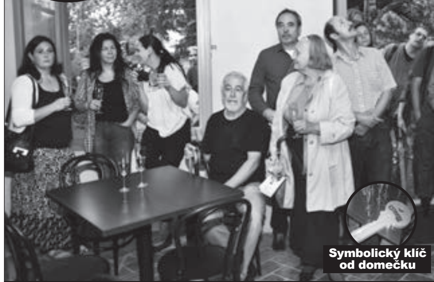
Symbolický klíč od domečku

„Umožníme využívání domku místním lidem i všem dalším občanským sdružením.“ Komunitní centrum Kampa