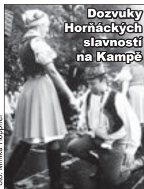
Dozvuky Hornáckých slavností na Kampě