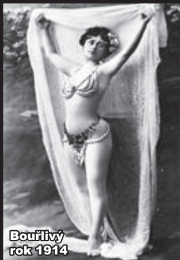
Bouřlivý rok 1914