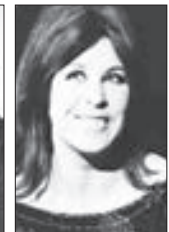
Eva Olmerová, zpěvačka