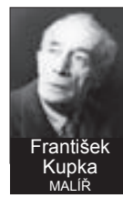
František Kupka MALÍŘ