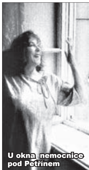
U okna nemocnice pod Petřínem

Ukázka z knihy J. Kříženeckého Eva Olmerová