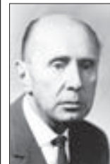
Václav Krška, režisér