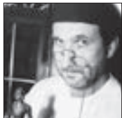
Roman Vopička Kafírna U sv. Omara

„Vlašská ulice, kterou obdivuji pro její italskou romantiku.“