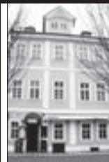
Hospoda U Měšťáneků (Nyní Kampa 14)