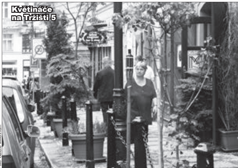
Květináče na Tržišti 5

Povolení se ovšem musí po několika letech obnovit. Na novém povolení se ale objevilo rozdílné umístění zeleně - u domu, nikoliv mezi sloupky u chodníku.