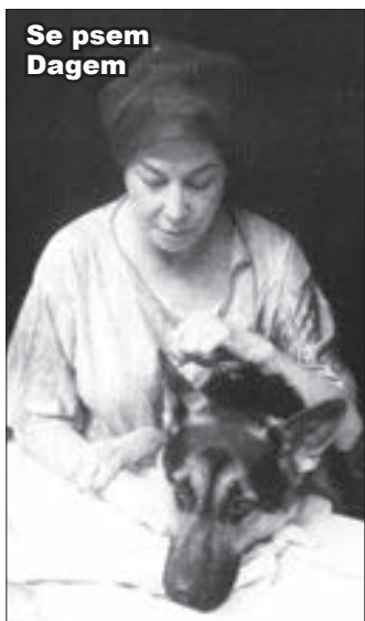
Se psem Dagem