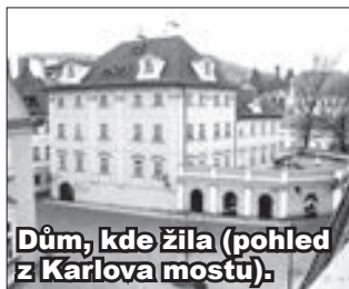
Dům, kde žila (pohled z Karlova mostu).