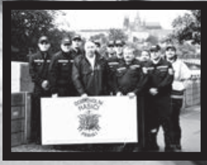
Dobrovolní hasiči v akci (velké foto) a ve skupině (malé foto).

Malá Strana - Hasiči si v polovině srpna stříhli cvičení, jehož cílem bylo prověřit ochranu Prahy před velkou vodou. Nejpostiženější oblastí byla