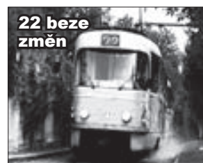
22 beze změn

Linka č. 12 je v úseku Malostranská - Strossmayerovo náměstí odkloněna přes Letenské náměstí a dál po své trase. Už tedy nepojede tradičně po nábřeží, ale oklikou přes Letnou. Škoda.