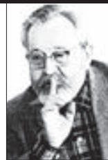
Jan Werich, herec, zpěvák a spisovatel