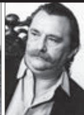
Jiří Trnka, výtvarník a ilustrátor