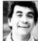
Petr Čepěk HEREC