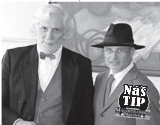
HAPKA S HORÁČKEM jsou svěží v životě i tvorbě.

12. září 2012, 20.30 h, Malostranská beseda