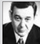
Josef Vinklář HEREC