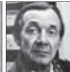
Josef Kemr MANŽEL, HEREČ