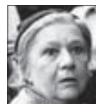
EVA SVOBODOVÁ herečka