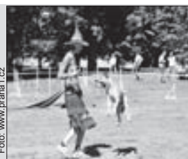
PSI na Střeleckém ostrově

Žofín - Na Žofíně tančili a zpívali dne 14. dubna baráčníci z celé republiky na 67. Všebaráčnickém krojovém plese. Hráli jim k tomu orchestry MDO Františka Kmocha a Jitřenka Praha. Obec baráčníků patří k nejstarším spolkům. V příštím roce oslaví 140 let vzniku.