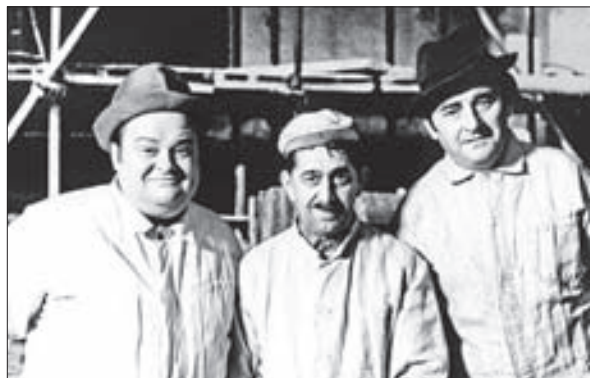
VE FILMU Světáci (s Brodským a Sovákem). Na snímku vpravo jako Král Ubu.