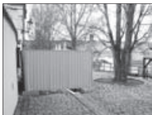
ZA TÍMTO plechem je hrozba

Řetěz je tak pevný jako jeho nejslabší článek