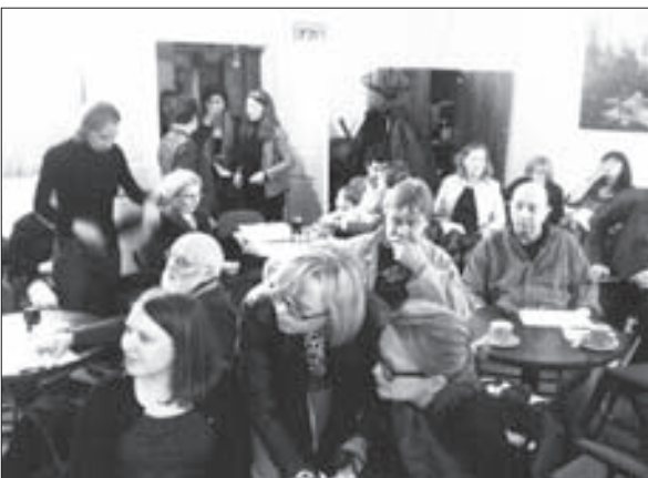
15. Valná hromada SOPMSH v Malostranské besedě.

Velmi by pomohlo, kdy se poslanci naučili lépe řídit