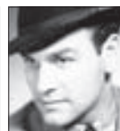
VÍTEZSLAV VEJRAŽKA herec