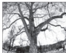
PLATAN v parku Kampa

Praha 1 - Radnice vyzývá občany, aby dávali podněty k označení stromů za „památné“. Na území Prahy 1 je takových stromů osm. Nejznámější je platan javorolistý v parku Kampa.