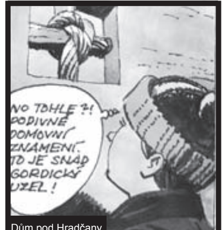
Dům pod Hradčany s netradičním domovním znamením v podobě uzlu