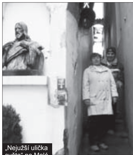
„Nejužší ulička světa“ na Malé Straně

Od 18 hodin jim budou na nádvoří muzea hrát a zpívat členové hudební skupiny Pa-běrky.