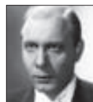
JAN PIVEC herec