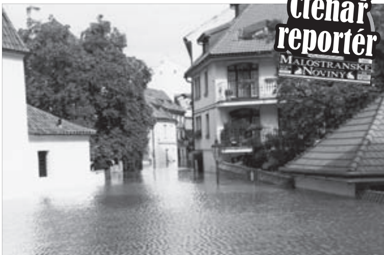
POVODNĚ roku 2002 na Malé Straně za sebou zanechaly spoušť.

Kampa - Je protipodvodňová stěna na Kampě opravdu protipodvodňová? Řetěz je tak pevný, jak pevný je jeho nejslabší článek. Kořeny stromů na náplavce na