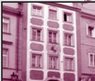
DŮM U Červeného Iva