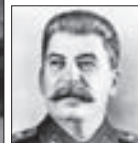
J. V. Stalin DIKTÁTOR