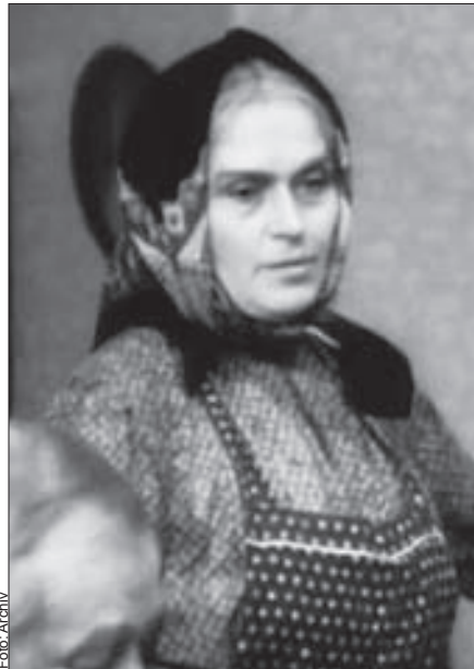
HEREČKA žila v letech 1911 - 1977