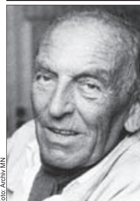
JIŘÍ MUCHA (1915 - 1991)