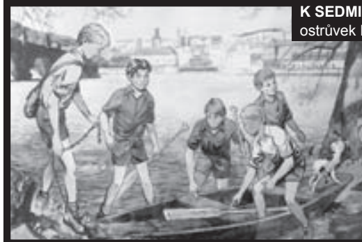
K SEDMI divům staropražských uliček patří ostrůvek Rychlých šípů u Karlova mostu