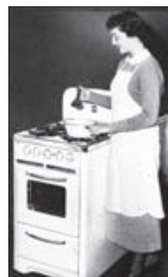
VAŘENÍ na plynu