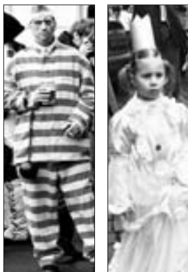
Věžeň a princezna