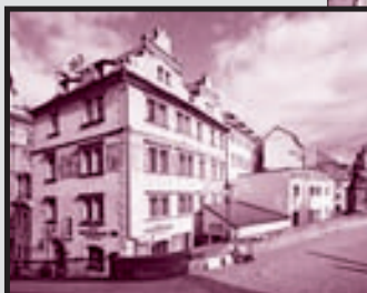
U Tří pštrošů