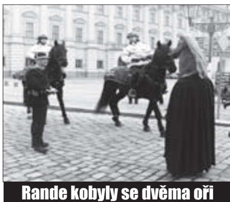
Rande kobyly se dvěma oři