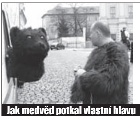
Jak medvěd potkal vlastní hlavu