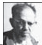
JOSEF SUDEK fotograf