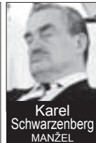
Karel Schwarzenberg MANŽEL