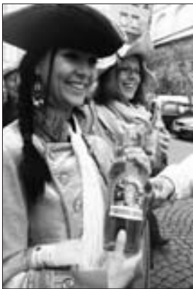
Slivovice místo kompasu