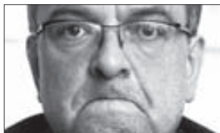
MINISTR Miroslav Kalousek