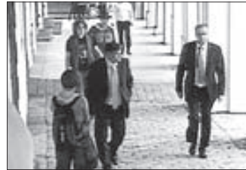
K. se zmateně vrací na západ

Malostr. nám. - Malostranským novinám se podařilo získat záznam z uliční kamery, který zachycuje ministra financí, jak fackuje kolemjdoucí-