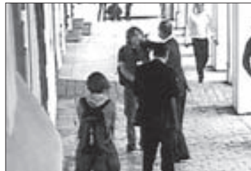
POKUS o druhou facku