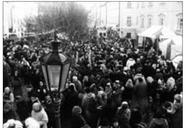
Náměstí Na Kampě čeká na medvěda