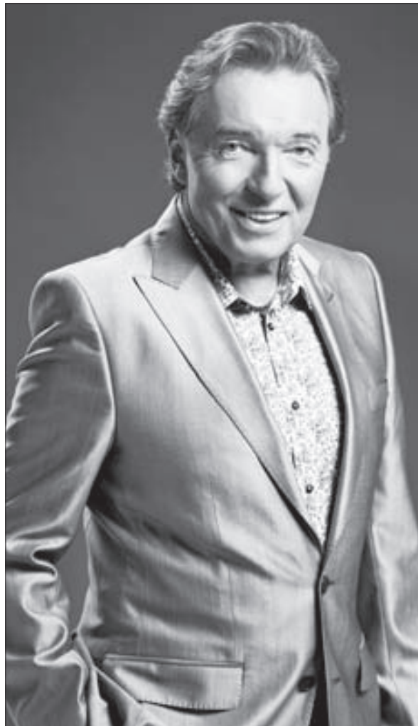
ZLATÝ slavík Karel Gott bude se svým zlatem v hrdle zlatým hřebem plesu a možná dá i dělovou ránu.

Žhavé zprávy z Vodičkovy 18. Viz též www.praha1.cz . Tel.: 221 097 111