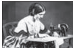
ŠÍTÍ na stroji