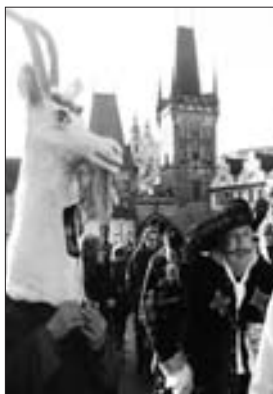
Koza a starosta