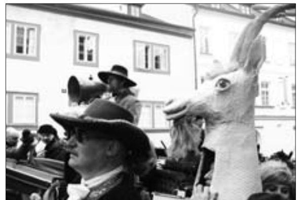
S kozou v patách