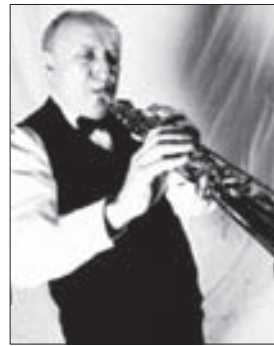
FELIX Slováček se svým zlatým saxofonem.